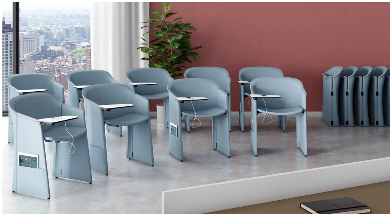
Pochette poltroncine con tavoletta, battery pack e tasca laterale.