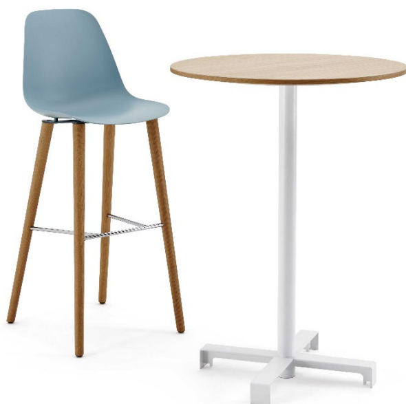
Sanmarino tavolino H105.