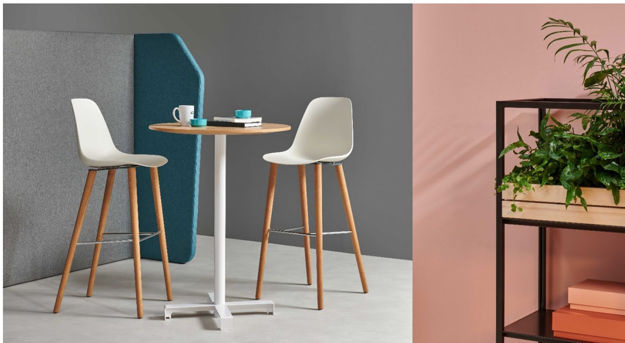
Sanmarino tavolino H105 con piano in Rovere Naturale lavorato a tavolato e base in metallo verniciato Bianco Neve opaco..