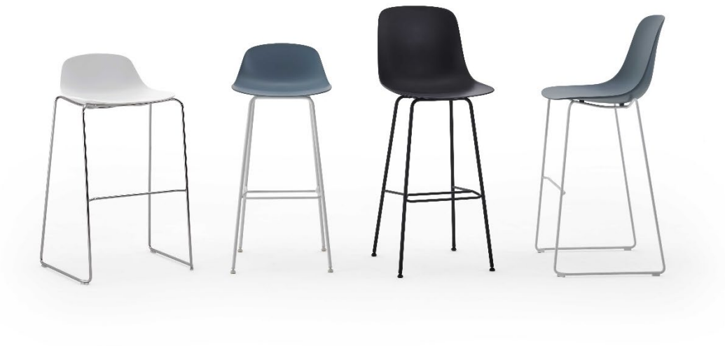
Famiglia Stool Shell.