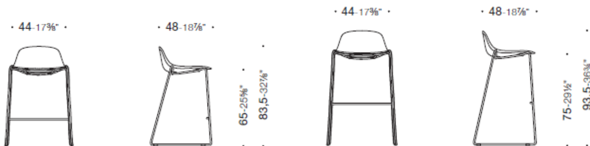
Shell, sgabello HS 65 con base a slitta lineare e schienale basso