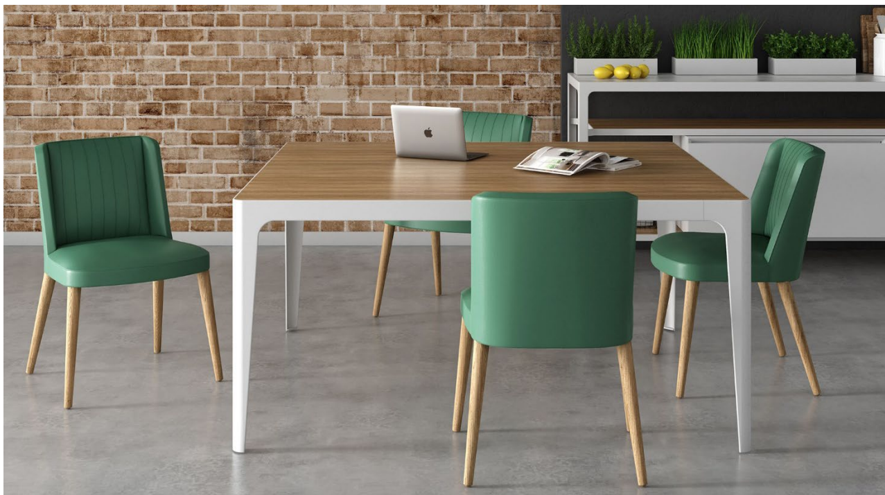
Moi in pelle con 4 gambe in Rovere Naturale.