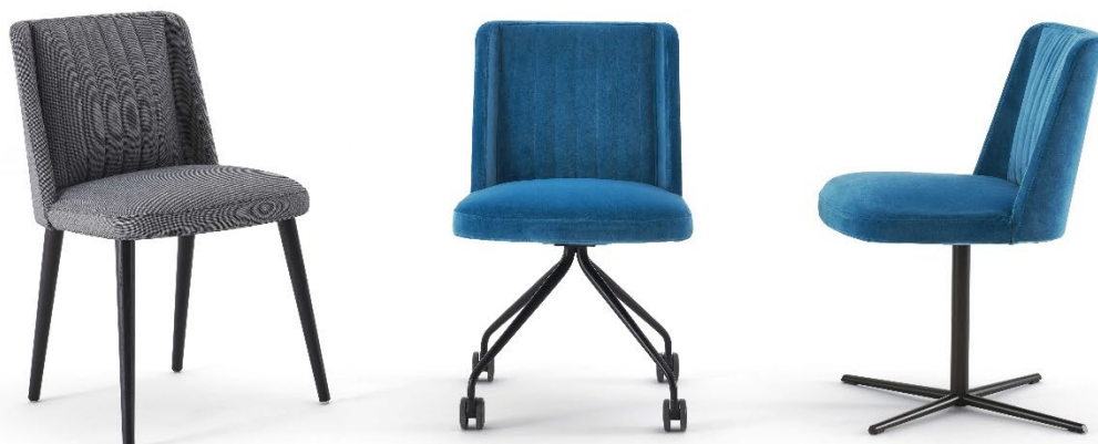
Moi in tessuto con 4 gambe in Rovere tinto scuro, con 4 razze piramidali su ruote e con base a croce.